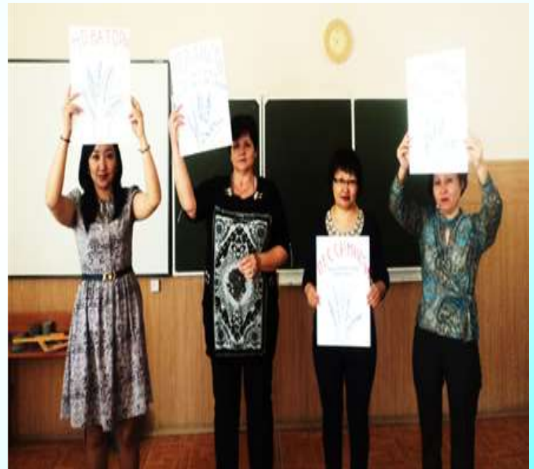
заседание методического совета